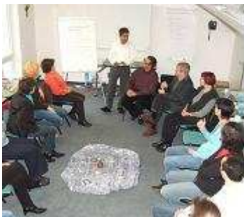
Foto: Anti-Bias- Training am ersten Präsenztage

Der erste Präsenztage stand ganz im Zeichen des Kennenlernens und der Technikerprobung. Der Vormittag wurde in einer Kombination aus Kennenlernübung und einem Anti-Bias-Training (Auseinandersetzung mit eigenen Vorurteilen und Sensibilisierung) gestaltet.