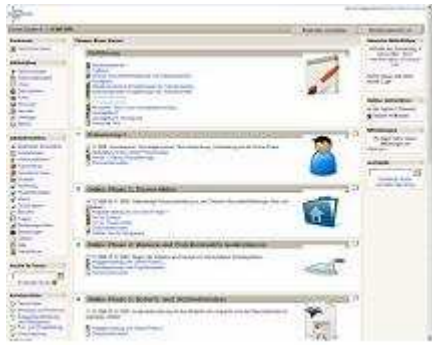
Abbildung: Einblick in den Kursraum

Die Teilnehmenden selbst kamen aus sehr unterschiedlichen Arbeitsfeldern: