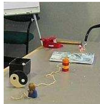
Foto: Lernlandschaft Kriegstrauma am zweiten Präsenztage

Diese eigenen „Produkte“ ergänzten den Wissenserwerb auf den verschiedenen Ebenen. Inhaltlich wurden dabei in der Auswertung ganz unterschiedliche Aspekte benannt („Grundlagen zur Gesundheitsförderung“, „Projektorganisation“, „Seminarmethoden“ usw.). Ein Gewinn an Technik- und Medienkompetenz kam für alle, die sich aktiv beteiligt hatten, hinzu.